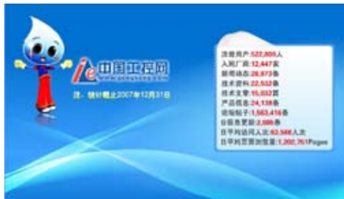
图2 统计截止日期2007年12月31日

在中国工控网不仅可以收获精神食粮，还可以收获物质食粮。我在中国工控网积极地参与有奖调查活动，获得网站赠予积分的同时，还可以获得各式各样的奖品。记得有一次获奖，是我在“施耐德Zelio Logic逻辑控制器产品知识有奖竞答”活动中，很幸运地获得了一个三等奖，奖品是当时价值500元的移动硬盘。这个奖品为我的工控生活增添了很大的方便。