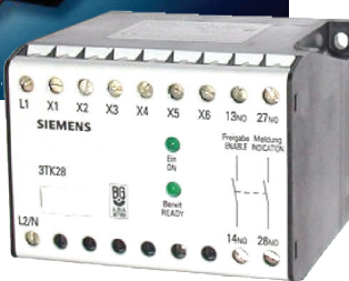
表2 智能安全设备对比

全保护技术的应用还不广泛。虽然我国早在上个世纪90年代就颁布了相应的安全标准，但与欧盟各国相比，我们尚未把它强化。从根本上说，由于我国目前在绝大多数行业还没有把机器安全保护标准上升为法令，工人、厂家和设备制造商并没有真正意识到安全保护的重要性。很多企业为了降低成本，不愿意增加安全保护装置的投入；一些设备制造商为了获得价格优势，通过省略安全保护装置来压缩成本，给事故的发生埋下了隐患。操作工人往往缺乏自我保护意识，不能清楚判别自己所处工作条件的危险性。在我国，依据功能安全标准实现“安全工厂”的理想还需要很长时间，这取决于我国经济、社会发